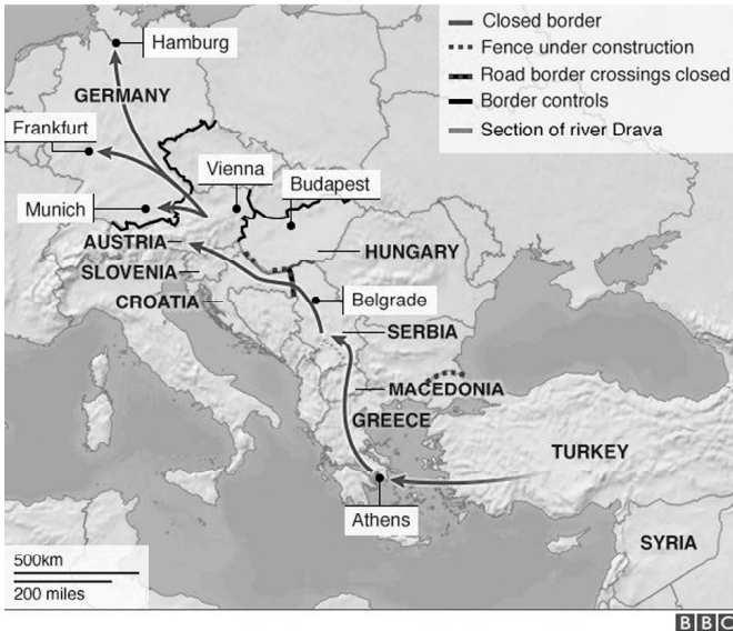
Main migrant route to Germany

लीबियाला जाऊ पहाणारे सगळेच लीबियात पोचतात असेही नाही. काहींना अटक होते. काहींवर गुंडांच्या, आतंकवाद्यांच्या टोळ्या बलात्कार करतात, मारहाण करतात, बाकी शारीरिक हाल करतात आणि पैसे मागतात. अनेक इच्छुकांचा लीबियाला जाण्याचा प्रयत्न इथे संपुष्टात येतो, मग युरप दूरच. ते कसेबसे मायदेशी परततात. हा प्रयत्न फसल्याची, कुटुंबीयांना पैसे