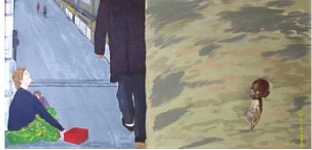
५. दारिद्र्य हे आणि ते