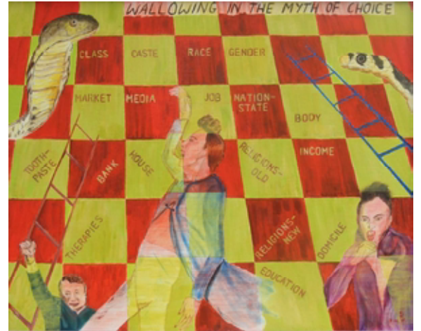
१२. निवडीचे स्वातंत्र्य