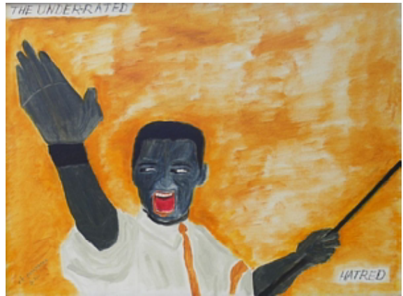
६. कमी गांभीर्याने पाहिल्या जाणाऱ्या गोष्टी - विद्वेष