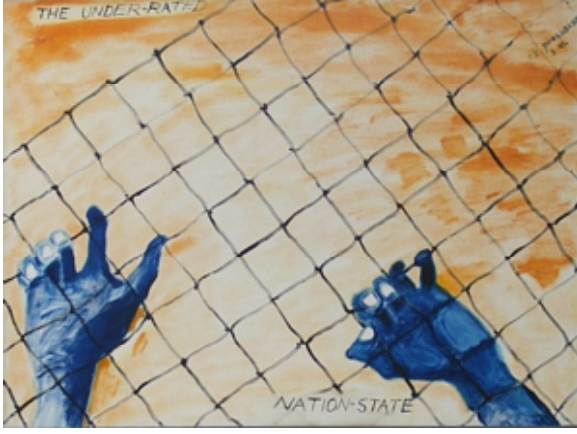
७. कमी गांभीर्याने पाहिल्या जाणाऱ्या गोष्टी - राष्ट्र ही संकल्पना