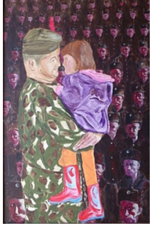
९. कोणाच्या तरी बापाला मारायला निघाला