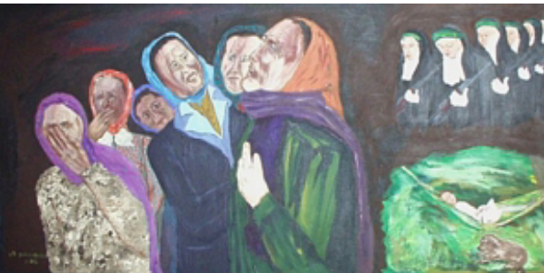
११. तिचे खाजगी अवकाश