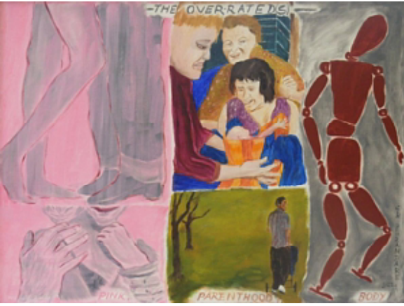
८. फाजील महत्त्व दिलेल्या गोष्टी - रोमान्स, पालकत्व, शरीर