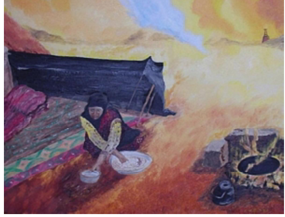
४. गरजा चैन नव्हे