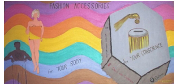
१३. फॅशन - शरीरासाठी व सदसद्विवेक बुद्धीसाठी